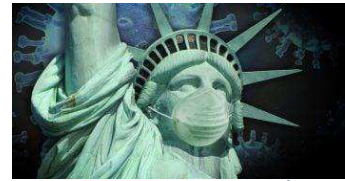
แพย์ใหญ่ทำเนียบขาวเตือนจำนวนผู้ติดเชื้อโควิดกำลังพุ่งสูงจนยอมรับไม่ได้

โบรกฯแนะ"ซื้อ" CHAYO รับอานิสงส์ NPL เพิ่มหนุนซื้อหนี้เสียมาบริหารต้นรายได้-กำไรโต