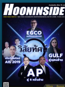
รายเดือน