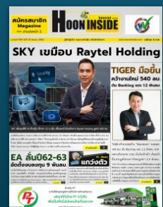
สเปเชียล