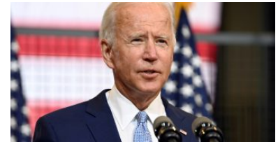
กัมมาเสียงยับยั้งไบเดนจะตรวจโควิดซ้ำ หลังผลตรวจครั้งแรกไม่พบติดเชื้อ

แท็ก สุสันต์ ยศะสินธุ์ รถจักรยานยนต์ ซโย กรุ๊ป ข้อมูล